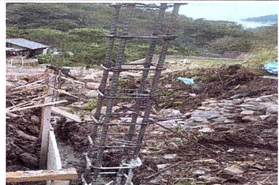
FOTO 4. CONSTRUCCION DE COLUMNAS