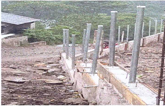
FOTO 3 SUSTITUCION DE TUVOS GALVANIZADA