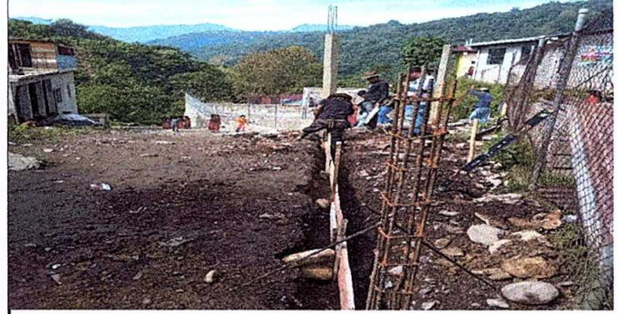
CONSTRUCCION DE MURO PARA LA MAYA