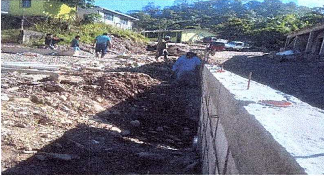
FOTO 1 MODULO 1 SUSTITUCION DE MURO PERIMETRAL