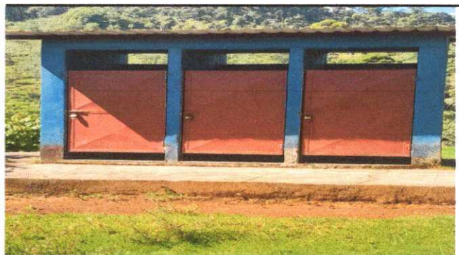
FOTO 4, MODULO 2, REPARACION Y MANTENIMIENTO DE PUERTAS, PINTURA Y TECHO DE BAÑOS