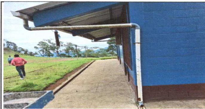
FOTO 3, MODULO 1, SUSTITUCIÓN DE CANALES Y BAJADAS DE AGUA