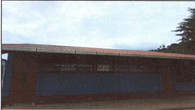
FOTO 1, MODULO 1, SUSTITUCION DE LAMINAS TROQUELADAS