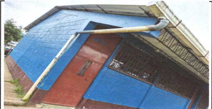
FOTO 2, MODULO 1, SUSTITUCION DE CANALES Y BAJADAS DE AGUA