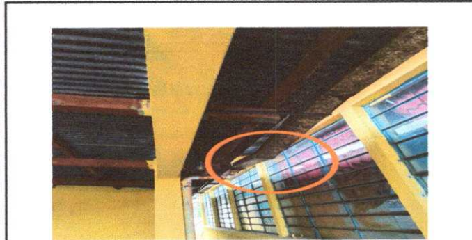
Foto 5: Modulo 3 sustitucion de canales de metal a pvc 6 m. lineales