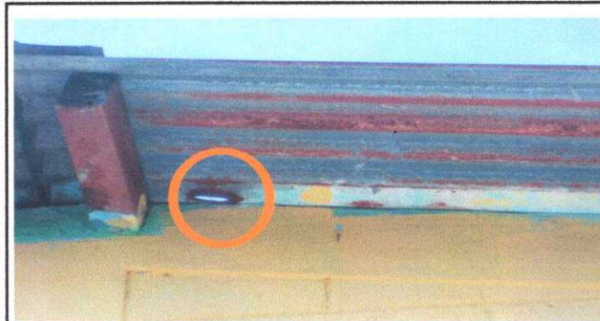
Foto 3: Modulos 3 Sustitucion de lamina, por lamina troquelada aluzinc calibre 26