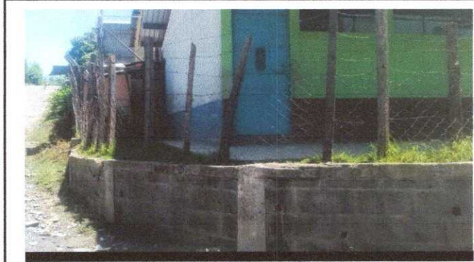
Foto1: Reparacion de muro perimetral.