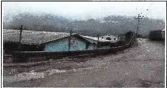
Foto6: MURO PERIMETRAL. Reparación de muro perimetral de blok con tuvo HG, malla galvanizada, soleras intermedia y columnas de sostenimiento

Observación: Si es necesario se pueden agregar hojas adicionales y actualizar el número de hojas.