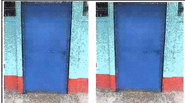
Foto2: MODULO 2 Sustitucion de puertas de metal