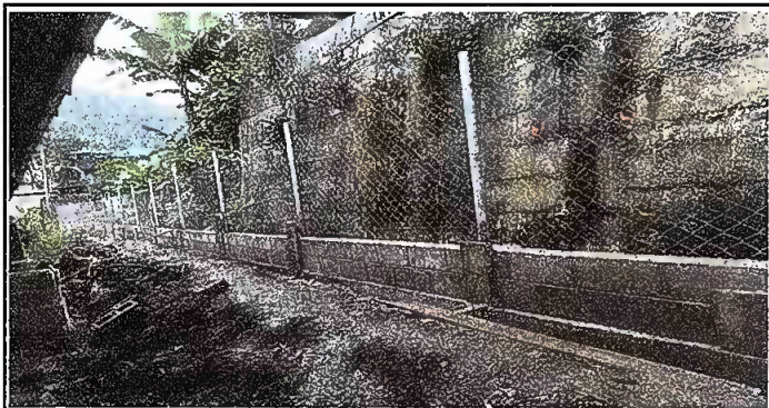
Foto5: MURO PERIMETRAL. Reparación de muro perimetral de blok con tuvo HG, malla galvanizada, soleras intermedia y columnas de sostenimiento