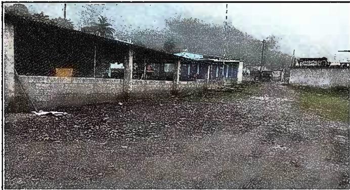
Foto3: MURO PERIMETRAL. Reparación de muro perimetral de blok con tuvo HG, malla galvanizada, soleras intermedia y columnas de sostenimiento