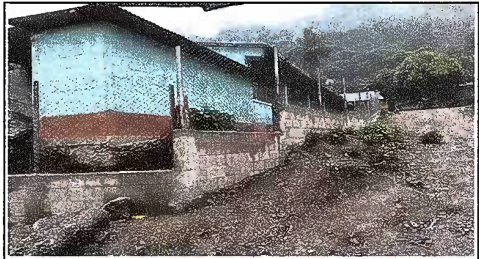
Foto4: MURO PERIMETRAL. Reparación de muro perimetral de blok con tuvo HG, malla galvanizada, soleras intermedia y columnas de sostenimiento