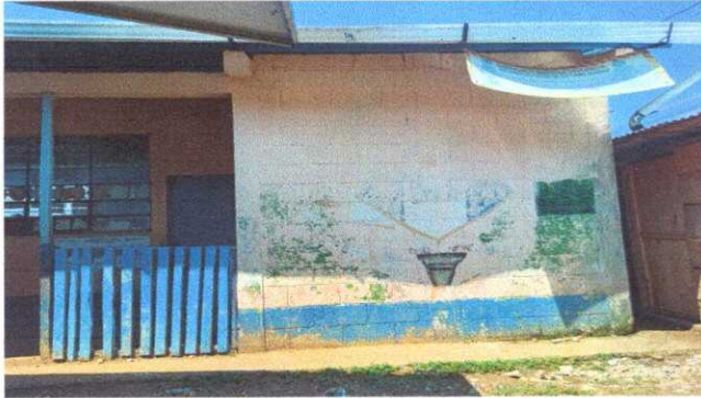
Foto1: MODULO 1 SUSTITUCION DE PINTURA GENERAL