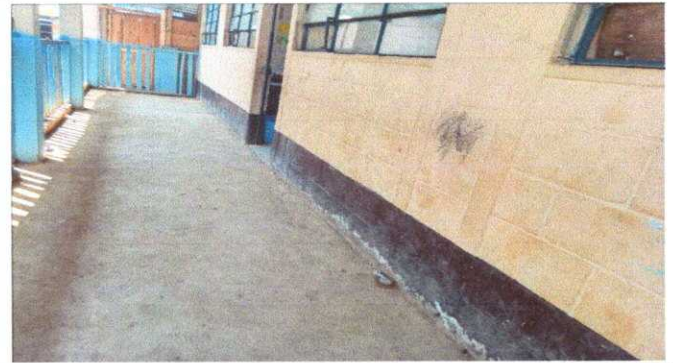
Foto 2: MODULO 1 SUSTITUCION DE PISO DE TORTA DE CONCRETO POR PISO GRANITO