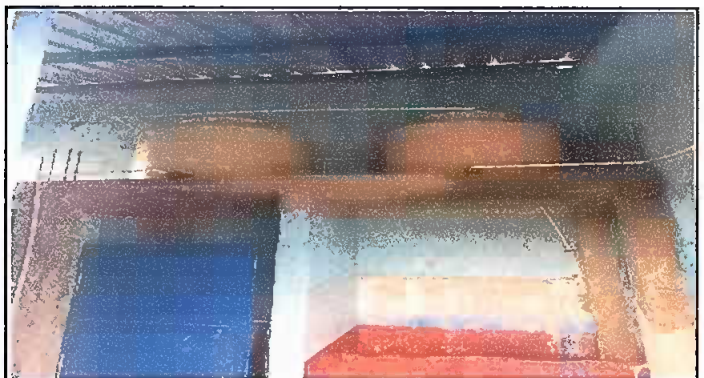
Foto 4: Modulo 2 Sustitución de depósito de agua de 450 litros y suministros e instalación de base de concretos