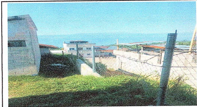
Foto1: Reparación de muro perimetral.