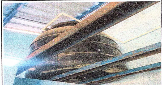
Foto 4: Modulo 2 Sustitución de depósito de agua de 1,000 litros y suministros e instalación de base de concretos