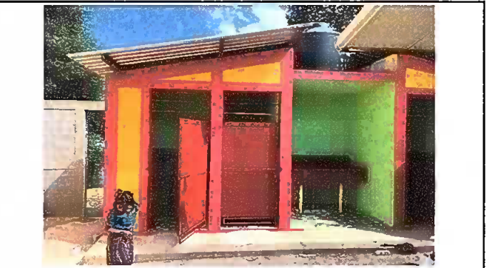
Foto 4: Baños: Sustitución de lámina en baños e instalación de azulejo en paredes de los sanitarios y reparación de puertas de metal, lijado y pintado.