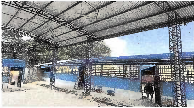
Foto1: Modulo 1: DESINTALACION DE LAMINA