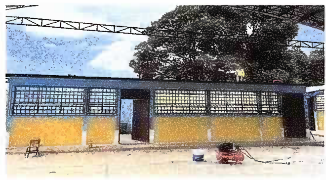
Foto 2: Modulo 2: MANTENIMIENTO A ESTRUCTURA DEL TECHO, Y PUERTAS Y APLICACIÓN DE PINTURA