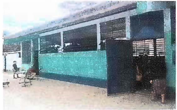
Foto 4: Colocación de marcos metálicos con sus respectivos vidrios en las ventanas