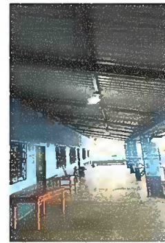
Foto 4: Sustitución de cableado eléctrico y sustitución de ducto eléctrico más accesorios.