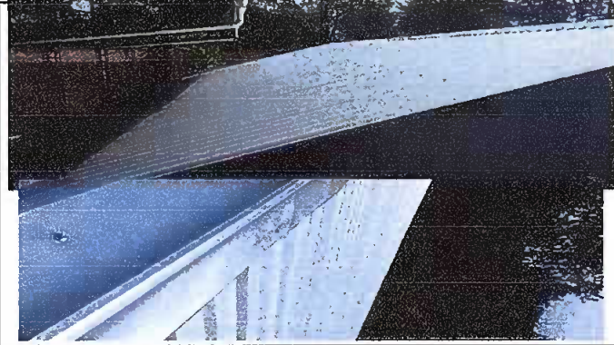
Foto 1: Sustitución de lámina, por lámina troquelada aluzinc calibre 26 y sustitución de capote de lámina para lámina troquelada.