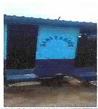
Foto 2: Sustitución de puerta en servicios sanitarios y sustitución de inodoros.