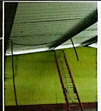
Foto 4: Sustitución de cableado eléctrico y sustitución de ducto eléctrico más accesorios.