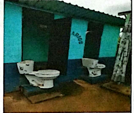
Foto 2: Sustitución de puerta en servicios sanitarios y sustitución de inodoros.