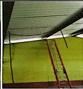
Foto 3: Sustitución de interruptores dobles, sustitución de toma corrientes dobles, sustitución de flipones y tableros, sustitución de plafoneras.