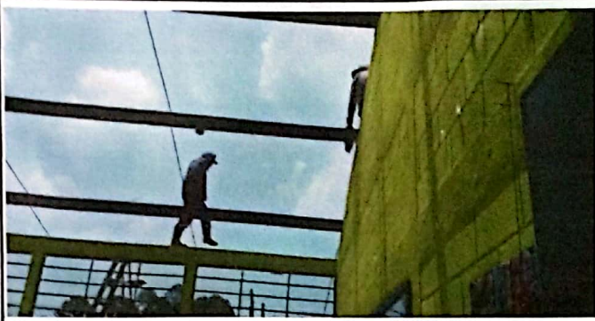
Foto 1: Sustitución de lámina, por lámina troquelada aluzinc calibre 26 y sustitución de capote de lámina para lámina troquelada.