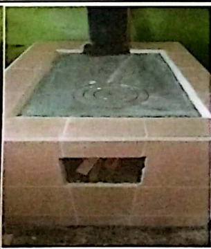
Foto 5: Sustitución de plancha de 3 hornillas, instalación de azulejo en estufa rural.