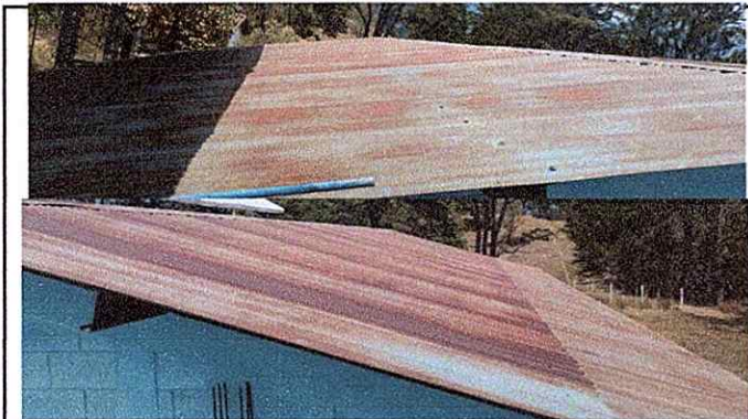
Foto1: Sustitución de lámina, por lámina troquelada aluzinc calibre 26 y sustitución de capote de lámina para lámina troquelada.