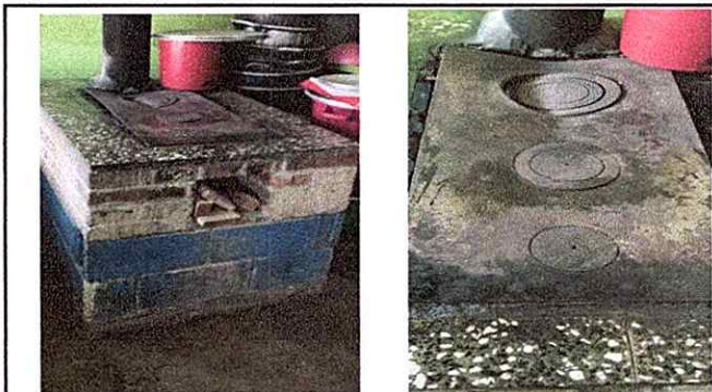
Foto 5: Sustitución de plancha de 3 hornillas, instalación de azulejo en estufa rural.