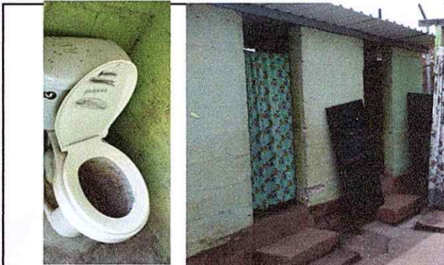
Foto 2: Sustitución de puerta en servicios sanitarios y sustitución de inodoros.