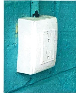
Foto 2: Módulo 2: Sustitución de focos, sustitución de apagadores, sustitución de toma corrientes, repacación de cables eléctricos.