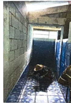
Foto 4: Módulo 4: Sustitución de puertas, sustitución de lavamanos, sustitución mingitorios, sustitución de accesorios de inodoro, reparación de conductos de depósito de agua.