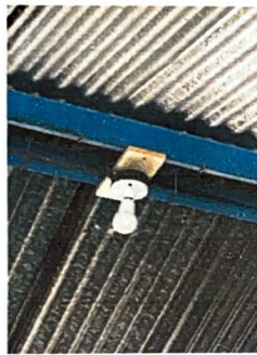
Foto 3: Foto 2: Módulo 2: Sustitución de focos, sustitución de apagadores, sustitución de toma corrientes, repacación de cables eléctricos.