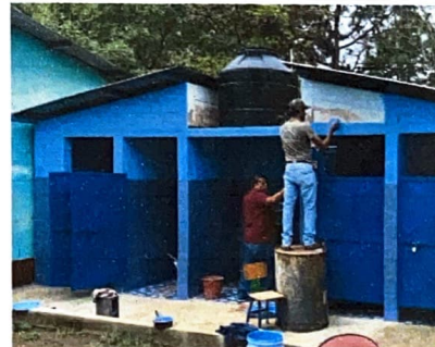
Foto 6: Módulo 5: reparación de depósito de agua, instalación de pila.

Observación: Si es necesario se pueden agregar hojas adicionales y especificar el número de hojas.