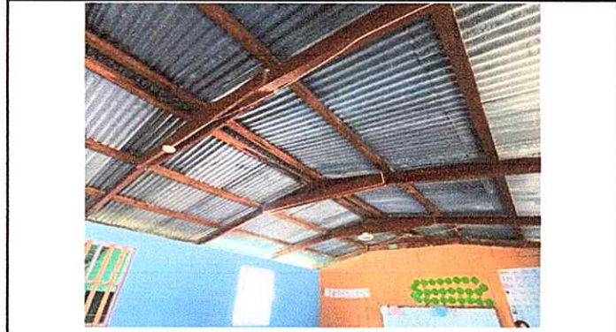
Foto 2: Módulo 2: Sustitución de focos, sustitución de apagadores, sustitución de toma corrientes, reparación de cables eléctricos.