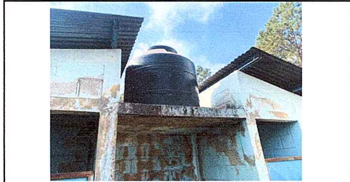
Foto 6: Módulo 5: reparación de depósito de agua, instalación de pila.

Observación: Si es necesario se pueden agregar hojas adicionales y actualizar el número de hojas.