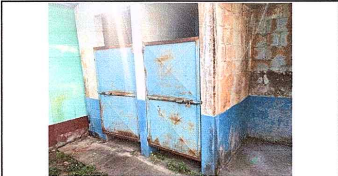
Foto 5: Módulo 5 reparación de puertas, sustitución de inodoros, sustitución de accesorios de inodoro, instalación de pila.