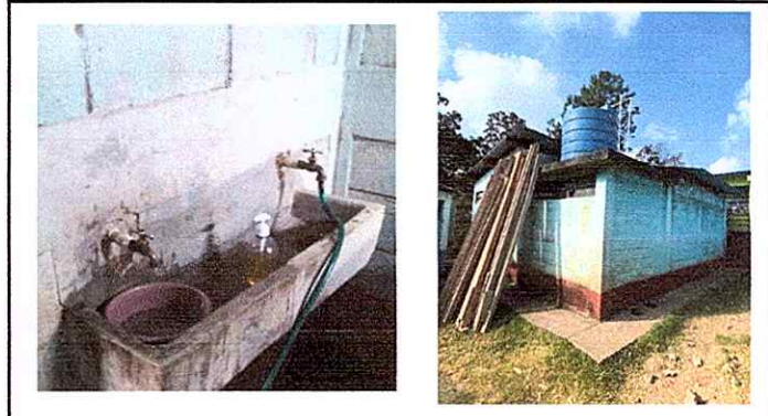
Foto 4: Módulo 4: Sustitución de puertas, sustitución de lavamanos, sustitución mingitorios, sustitución de accesorios de inodoro, reparación de conductos de depósito de agua.