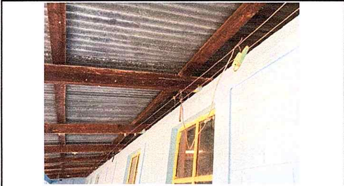
Foto 3: Foto 2: Módulo 2: Sustitución de focos, sustitución de apagadores, sustitución de toma corrientes, reparación de cables eléctricos.