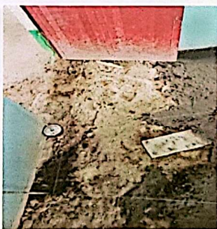
Foto 5: Durante el proceso se dio inicio a la sustitución de la torta de concreto