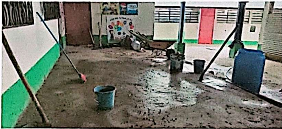
Foto 3: Durante el proceso se dio inicio al mejoramiento del corredor de la escuela