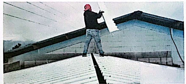
Foto 6: Durante el proceso se colocó lámina troquelada aluzinc calibre 26 y sus respectivos capotes

Observación: Si es necesario se pueden agregar hojas adicionales y actualizar el número de hojas.