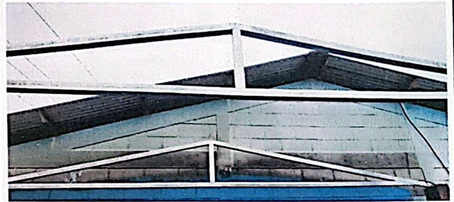
Foto 4: Durante el proceso se dio inicio a la colocación de costaneras