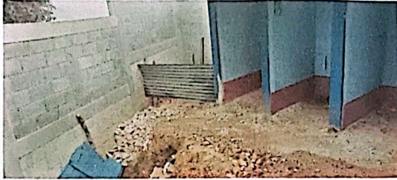
Foto 1: Durante el proceso se inicio a la remodelación de los inodoros