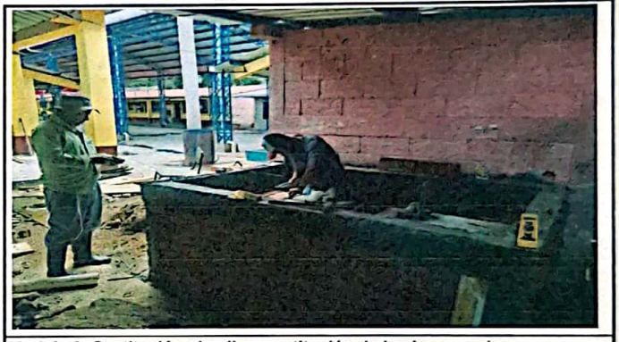
Modulo 3: Sustitución de pila y sustitución de lamina en galera