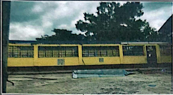
Módulo 1: Mantenimiento de Estructura