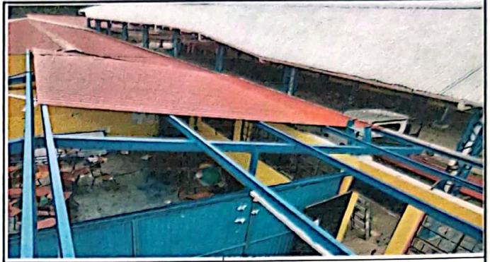
Módulo 1: Sustitución de lamina a lamina Troquelada calibre 26