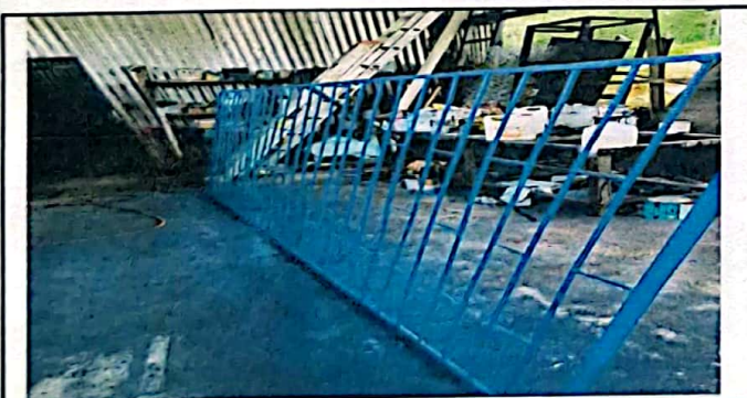
Modulo 4: Suministro de Balcones a 2 aulas