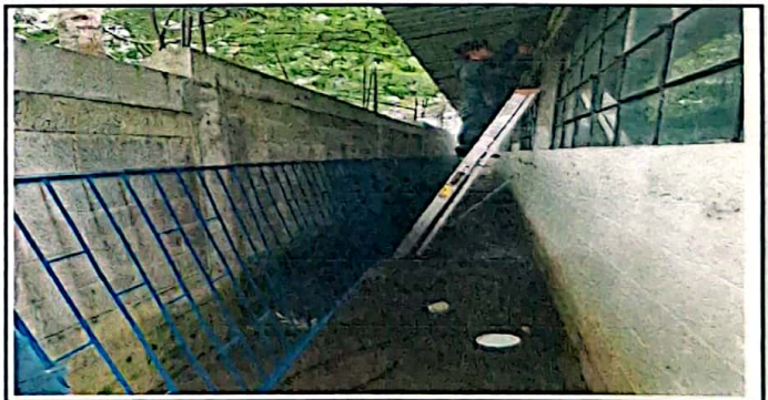
Modulo 4: Suministro de valcones a 2 aulas

Observación: Si es necesario se pueden agregar hojas adicionales y actualizar el número de hojas.