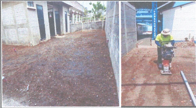
Módulo 1: Sustitución de piso de torta de concreto