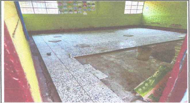
Módulo 2: Sustitución de piso de cemento líquido