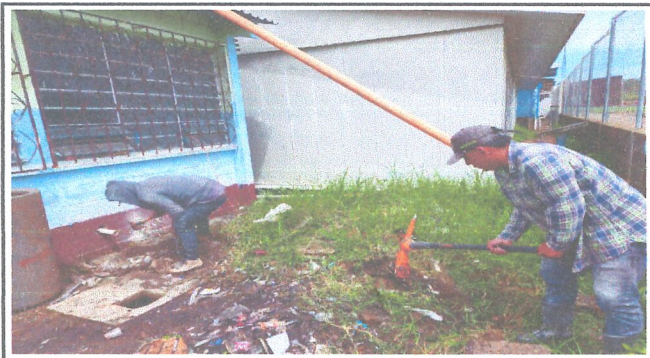
Módulo 3: Sustitución de caja de registro