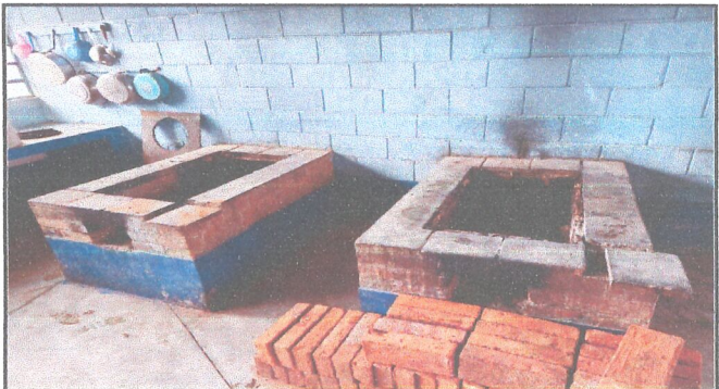
Módulo 3: Mantenimiento a estufa rural