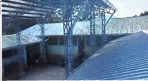
Foto1: Finalizacion de techado en el modulo 1