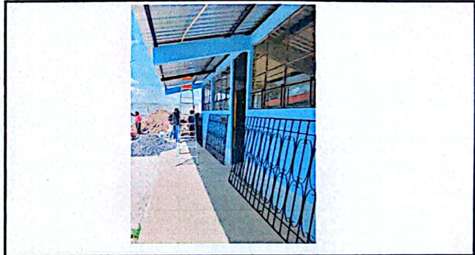
Foto 4: Modulo 1, fabricacion e instalacion de balcones de hierro para ventanas.