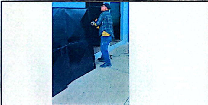
Foto 5: Modulo 2, fabricación e Instalación de puertas de metal en baños.