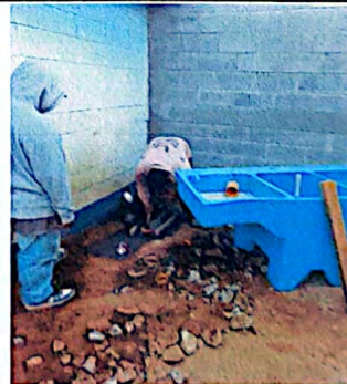
Foto 6: Modulo 4, Sutilucion de pila de cemento de dos lavaderos.

Observación: Si es necesario se pueden agregar hojas adicionales y actualizar el número de hojas.