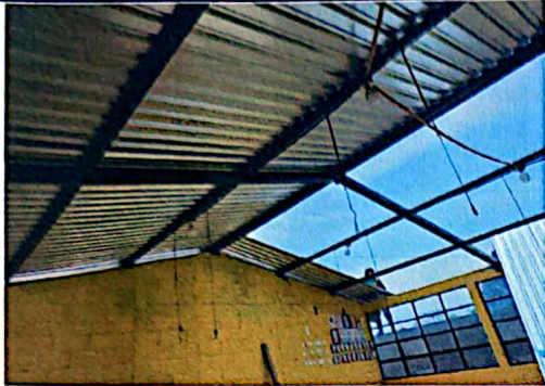
Foto1: Modulo 1, mantenimiento soporte metal.