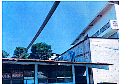
Foto 2: Modulo 1, sustitucion de lamina, por lamina troquelada aluzinc calibre 26.