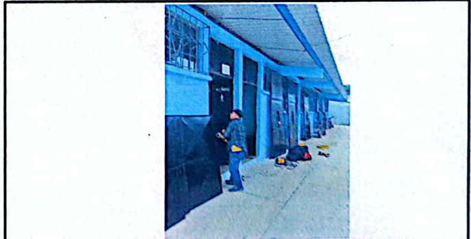
Foto 6: Modulo 2, fabricación e instalacion de puertas de metal en modulos.

Observación: Si es necesario se pueden agregar hojas adicionales y actualizar el número de hojas.