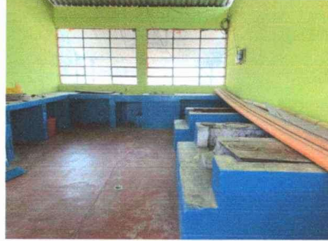
Foto 2. MODULO 1: Sustitución y Reparación de estufa rural (completa) incluye chimenea y plancha de metal