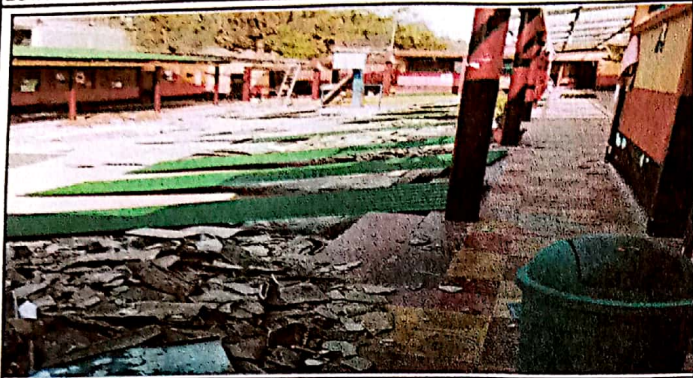
Foto1: cambio de Lámina duralita por lámina Troquelada.