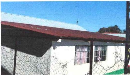
Foto 5: Sustitución completo de lamina simple a lámina troquelada de 2 aulas.