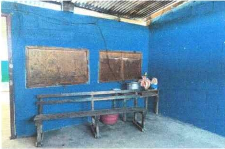
Foto7: Sustitución de ventanas de madera de la cocina.