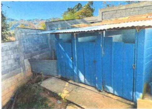
Foto 9: Sustitución de puertas de madera de servicios sanitarios.