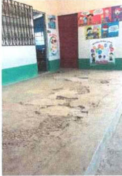
Foto1: Sustitución de torta de cemento por un nuevo.