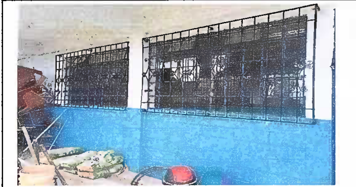
Foto1: Modulo 1, suministro e instalacion en balcones de ventanas de metal.