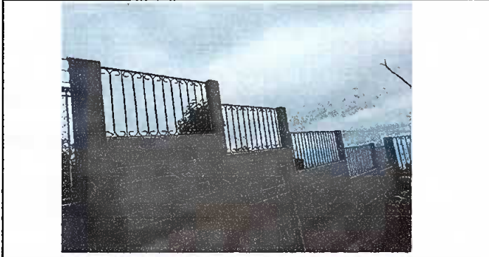
Foto 5: muro perimetral. Suministro de instalación de barandas de metal,