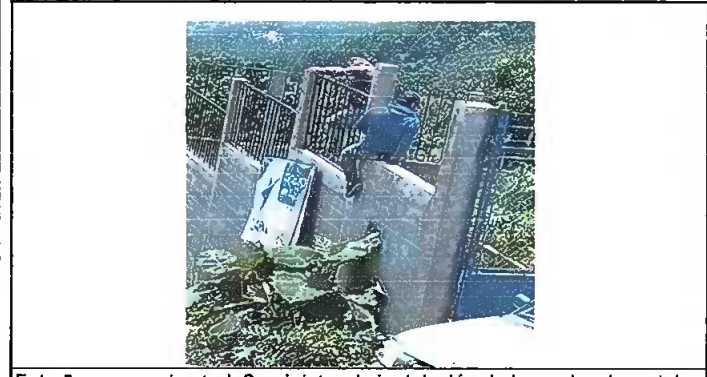
Foto 5: muro perimetral. Suministro de instalación de barandas de metal,