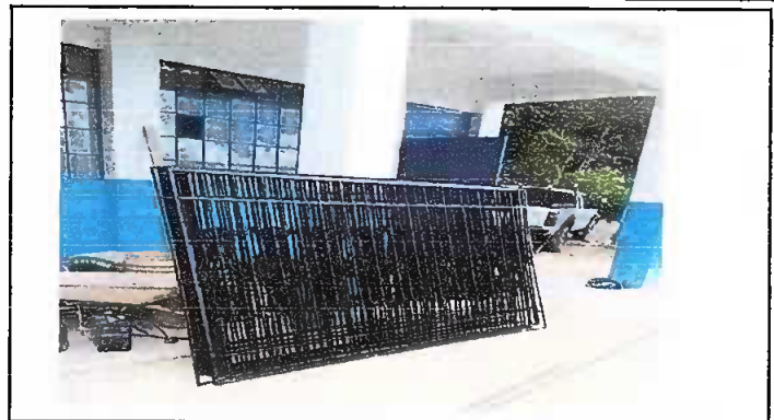
Foto 2: modulo 1 suministro e instalacion de balcones en ventanas de metal.