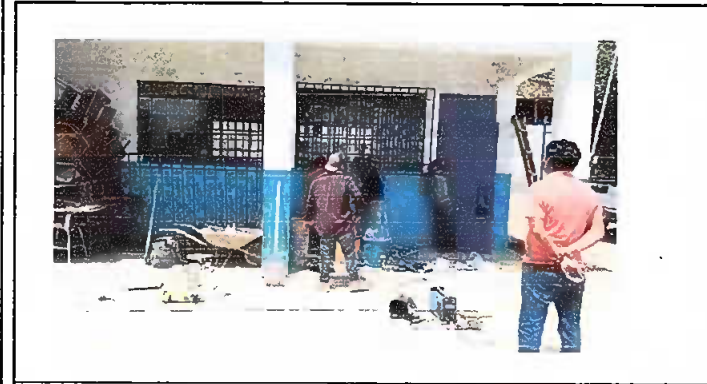
Foto1: Modulo 1, suministro e instalacion en balcones de ventanas de metal.