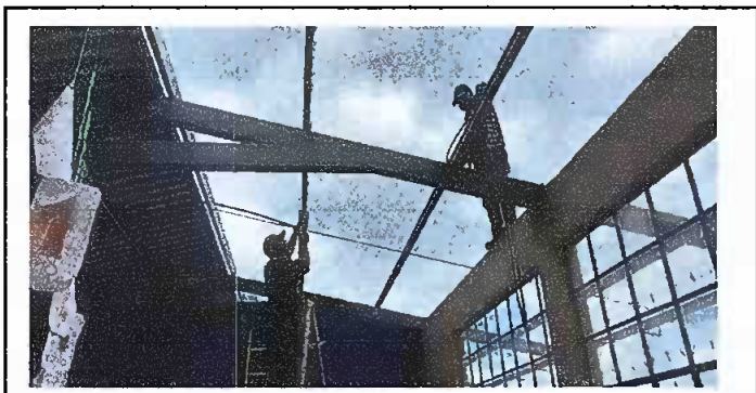
Foto 5: Sustitución de lámparas tipo LED e instalaciones de unidades unidades de luz(incluye interruptor, ducto y cable eléctrico)