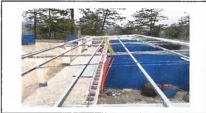
Foto1: Cambio de lámina, por lámimna troquealada aluzinc calibre 26