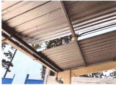
Foto1: Cambio de lámina, por lámimna troquealada aluzinc calibre 26