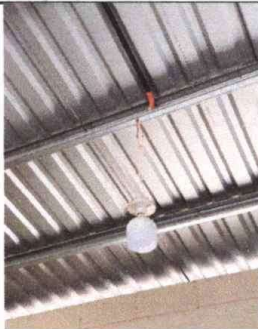
Foto 5: Sustituciòn de lámparas tipo LED e instalaciones de unidades unidades de luz(incluye interruptor, ducto y cable elèctrico

Observaciòn: Si es necesario se pueden agregar hojas adicionales y actualizarlas con las de hojas.