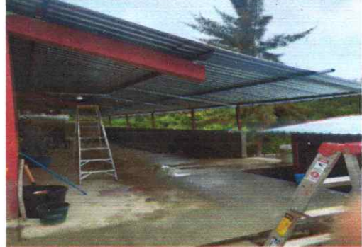
Módulo 1: Foto 2: Sustitución de lámina por lámina troquelada calibre 26