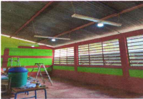
Módulo 1: Foto 3: Sustitución de plafonera, candelas por focos led y pintado de interiores del módulo.