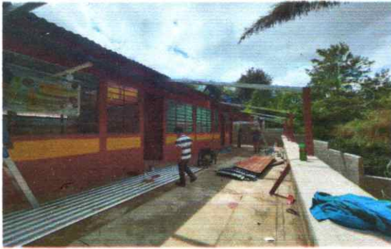
Módulo 1: Foto1: Sustitución de lámina y capotes