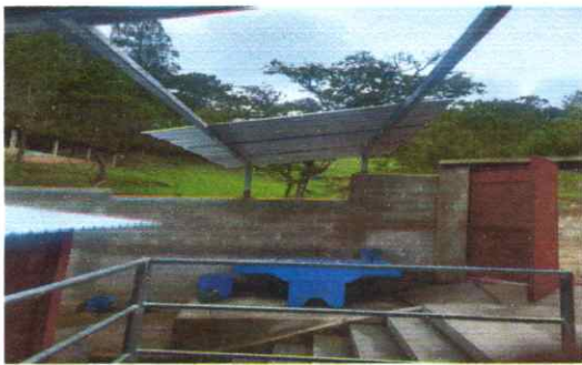
Módulo 2: Foto 5: Sustitución de pila de cemento, baranda y gradas.

Observación: Si es necesario se pueden agregar hojas adicionales y actualizar el número de hojas.