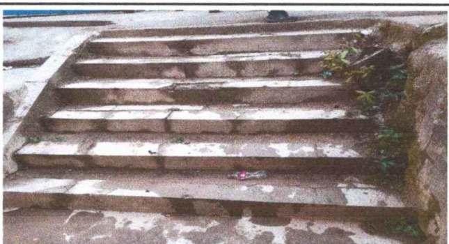
Módulo 2: Foto 6: Sustitución de gradas.

Observación: Si es necesario se pueden agregar hojas adicionales y actualizar el número de hojas.