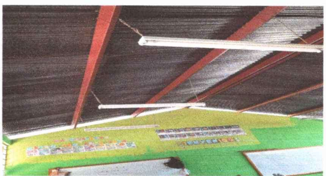
Módulo 1: Foto 4: Sustitución de plafonera, candelas por focos led y pintado de interiores del módulo.