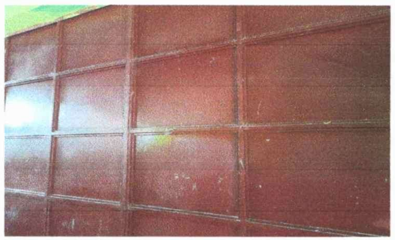
Módulo 1: Foto 3: Mantenimiento a portón divisor de aulas.