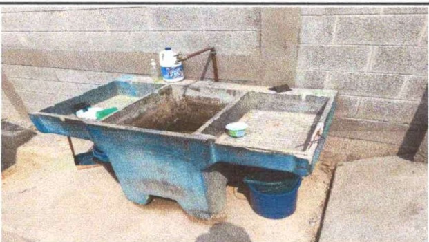
Módulo 2: Foto 5: Sustitución de pila de cemento.