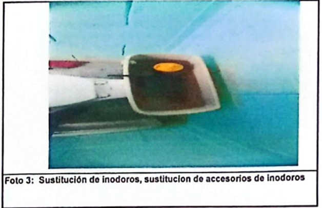
Foto 3: Sustitución de inodoros, sustitución de accesorios de inodoros