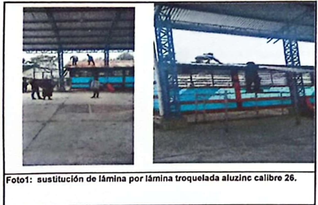
Foto1: sustitución de lámina por lámina troquelada aluzinc calibre 26.