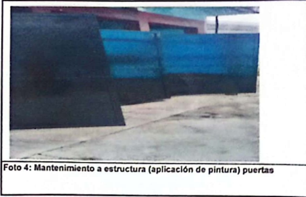
Foto 4: Mantenimiento a estructura (aplicación de pintura) puertas