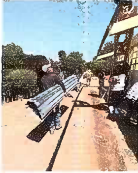
Foto1: cambio de techado