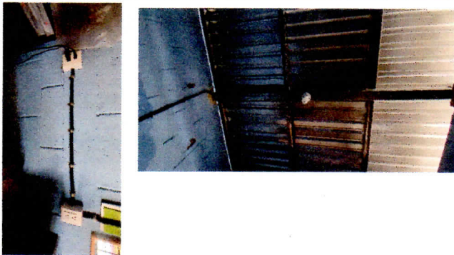
Modulo 1: Reparación de cableado eléctrico, sustitución de focos, sustitución de interruptores triple apagador con caja plástica y sustitución de tomacorrientes dobles con caja plástica