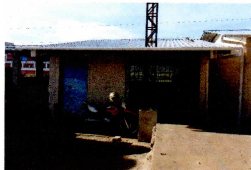
Modulo 2: Sustitución de lámina, por lámina troquelada aluzinc calibre 26, sustitución de capote de lámina para lámina troquelada, sustitución de elementos de fijación (tornillos), sustitución de canal PVC, reparación de bajada de agua pluvial, tubo PVC 3"