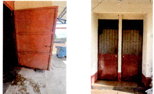
Modulo 3: sustitución de puerta de servicios sanitarios, reparación de depósito de agua, Y sustitución de azulejo en lava manos y sanitarios

Observación: Si es necesario se pueden agregar hojas adicionales y actualizar el registro de fotos.