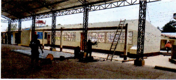
Modulo 1: sustitución de estructura de soporte de madera por metal, sustitución de lámina, por lámina troquelada aluzinc calibre 26, sustitución de elementos de fijación (tornillos) y sustitución de capote de lámina para lamina troquelada.