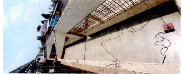
Modulo 1: sustitución de bajada de agua pluvial, tubo PVC 3" y sustitución de canal de pvc 3"