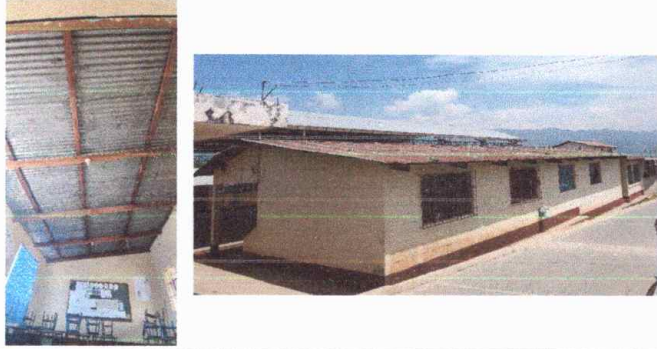
Modulo 1: sustitución de estructura de soporte de madera por metal, sustitución de lámina, por lámina troquelada aluzinc calibre 26, sustitución de elementos de fijación (tornillos) y sustitución de capote de lámina para lamina troquelada.