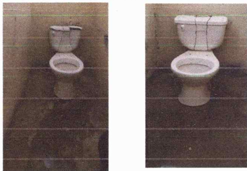
Modulo 3: sustitución de sanitario, sustitución de accesorios de inodoro.