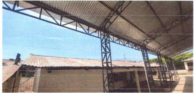
Modulo 1: sustitución de bajada de agua pluvial, tubo PVC 3" y sustitución de canal de pvc 3"