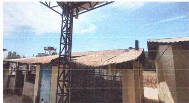
Modulo 2: Sustitución de lámina, por lámina troquelada aluzinc calibre 26, sustitución de capote de lámina para lámina troquelada, sustitución de elementos de fijación (tornillos), sustitución de canal PVC, reparación de bajada de agua pluvial, tubo PVC 3"