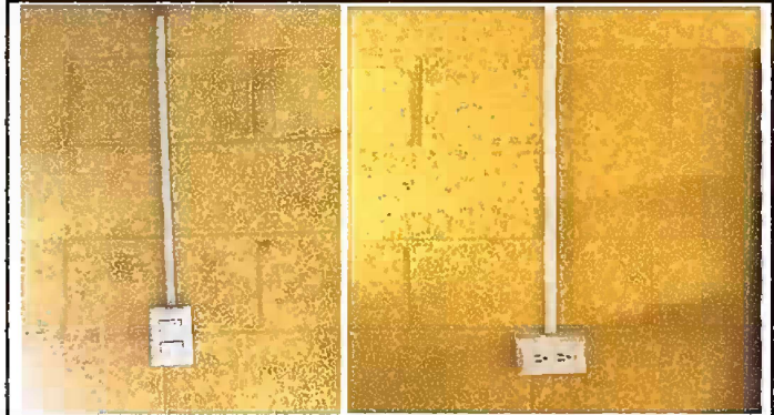
Foto 8. Módulo 2: Reparación del cableado eléctrico, sustitución de interruptores y sustitución de tocarrientes.