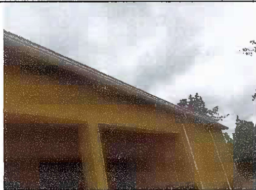
Foto 3. Módulo 1: Sustitución de canal de PVC, pescante y bajada de agua