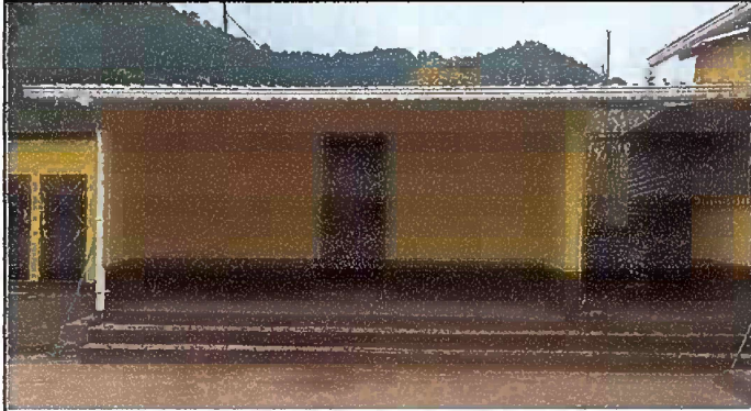
Foto 7. Módulo 2: Sustitución de estructura de soporte de madera por metal y Sustitución de lámina por lámina troquelada aluzinc calibre 26