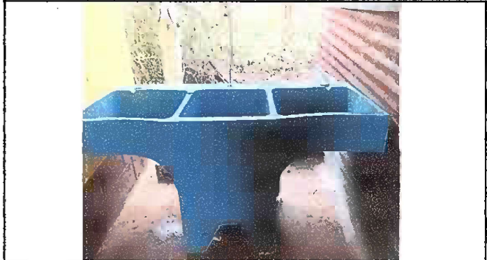
Foto 10. Módulo 2: Sustitución de pila de cemento de dos lavaderos