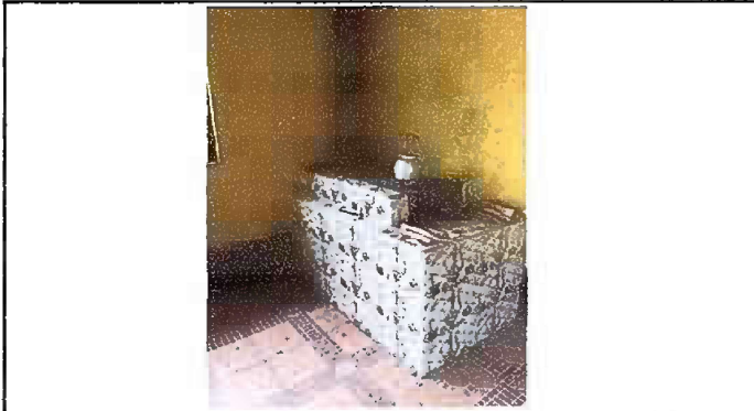
Foto 9. Módulo 2: Instalación de azulejo en estufa rural y piso cerámico en suelo.