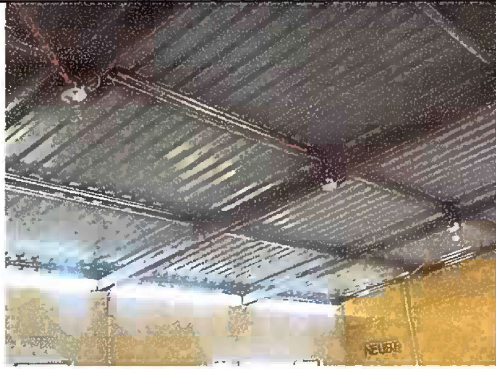
Foto 1. Módulo 1: Sustitución de estructura de soporte de madera por metal.