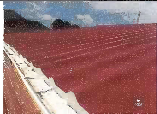
Foto 2. Módulo 1: Sustitución de lámina por lámina troquelada aluzinc calibre 26