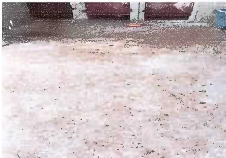
Foto 11. Modulo 1: Sustitución de piso de torta de concreto, por torta de concreto