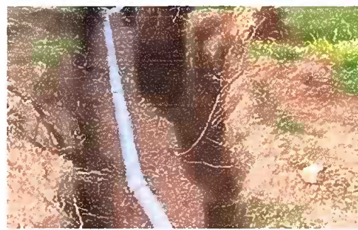
Foto 12. Modulo 1: Sustitucion de tuberia de pvc linea principal de aguas negras

Observación: Si es necesario se pueden agregar hojas adicionales y actualizar el número de hojas.