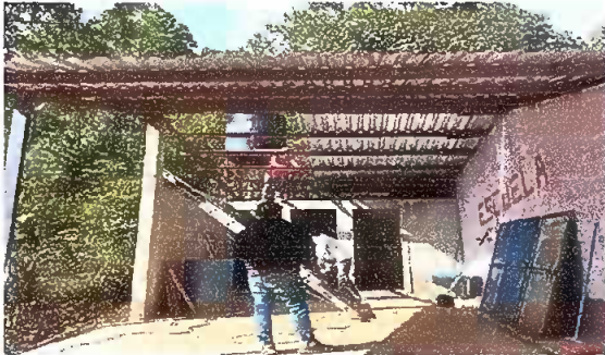
Foto 9. Modulo 1: Sustitucion de estructura de soporte de metal, por metal