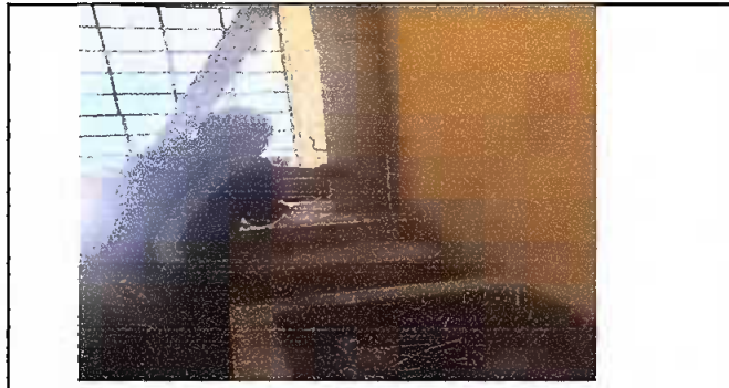
Foto 4. Modulo 1: Sustitucion de estufa rural (completa incluye chimenea y plancha de metal)