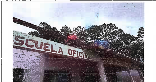
foto 2. Modulo 1: Sustitución de elementos de fijación (tornillos)