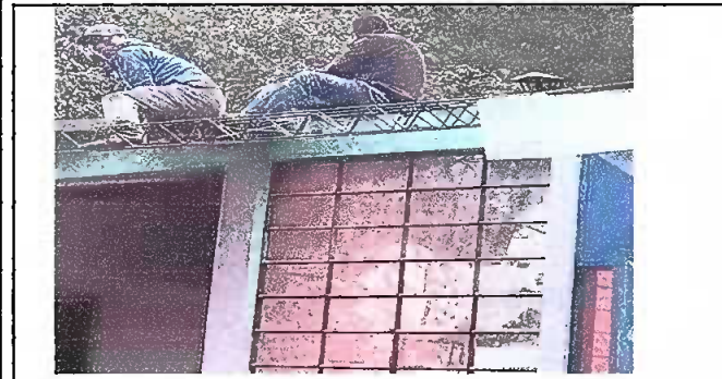
foto 1. Modulo 1: Sustitución de lámina por lamina troquelada aluzinc calibre 26