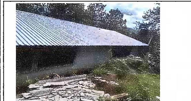
Foto 3. Modulo 1: Sustitución de capote calibre 26 para lamina troquelada