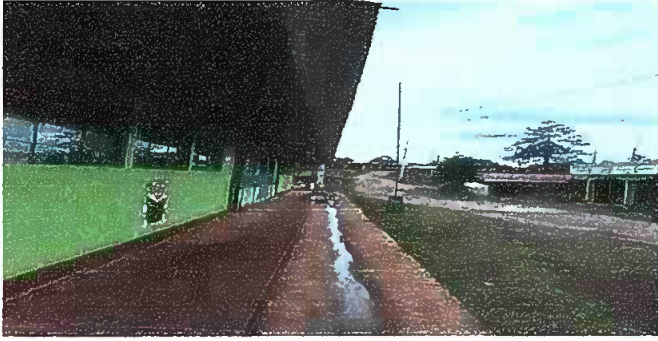
Foto 1: MODULO 1, sustitución de canal de metal, sustitución de soporte o pescante de metal para canal, sustitución de bajada de agua pluvial de metal por tubo PVC3".