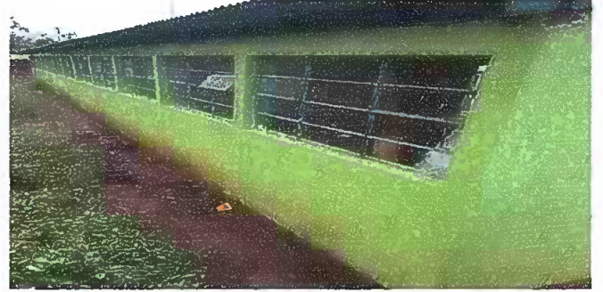
Foto 2: MODULO 1, Sustitucion de lamina, por lamina troquelada aluzcinc calibre 26, ya que la existente esta causando daños en la pared porque esta muy corta, lo que hace que la pared se humedezca y puede causar