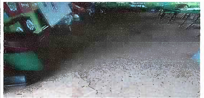
Foto 4: MODULO 1 : sustitución de piso de torta de concreto por piso cerámico