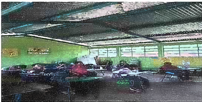
Foto 5: MODULO 1, Reparacion de cableado electrico y sustitucion de focos ahorradores