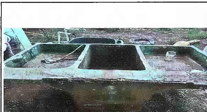
Foto 9: MODULO , sustitución de lavamanos mas accesorios e instalación de lavamanos.