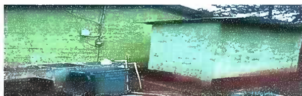
Foto 10: MODULO 2: Sustitucion de deposito de agua de 2500 litros.