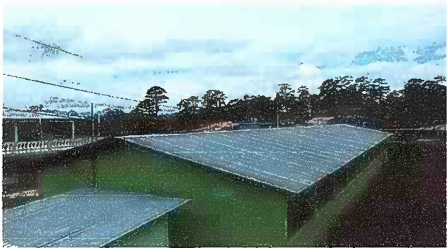
Foto 3: MODULO 1, Sustitucion de capote, por capote aluzcinc y elementos de fijación