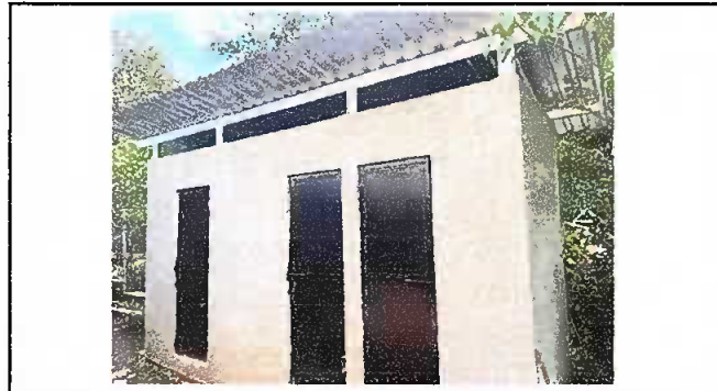
Módulo 2. Colocación de lámina troquelada aluzinc Calbre 26, cernido en muros, colocación de estructura portante, sustitución de puertas de madera por metal.