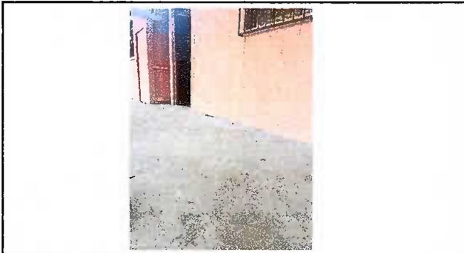
Módulo 1. Reparación de torta de cemento.