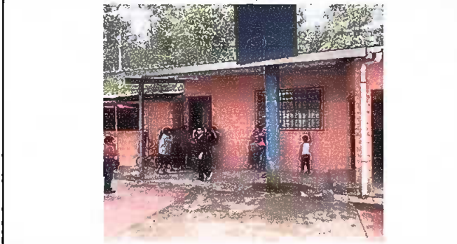
MÓDULO 1: Sustitución de estructura portante, colocación elementos de fijación, sustitución de puertas de madera por metal, sustitución de puertas de madera por metal.