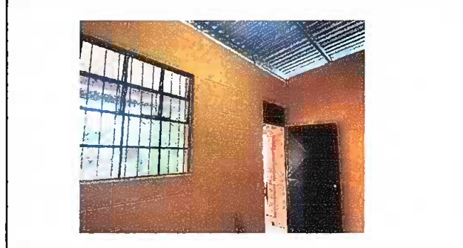
MÓDULO 1: Aplicación de pintura en muros interiores y exteriores, sustitución de cableado eléctrico, cambio de focos y plafoneras.