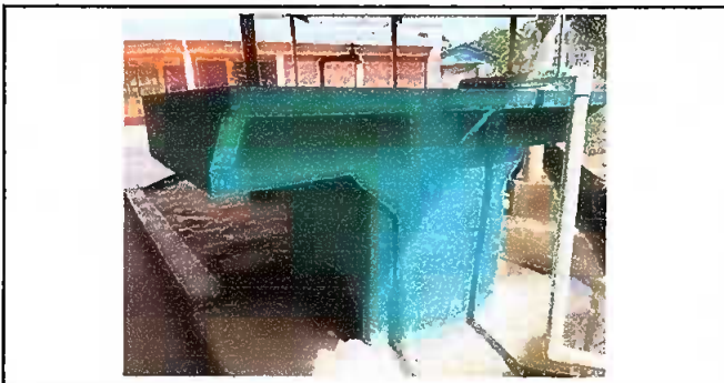
Módulo 2. Sustitución e instalación de pila de cemento de dos lavadores.