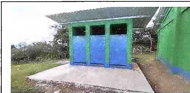
Foto 5: Módulo 2: Lámina troquelada cal.26 y estructuras instaladas