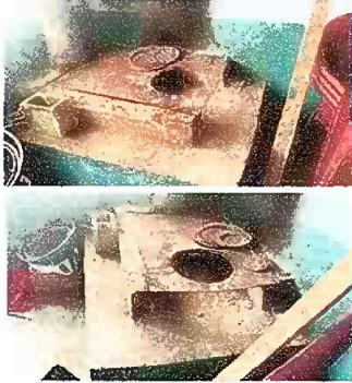
Foto1 Módulo 1: Mantenimiento de estufa rural