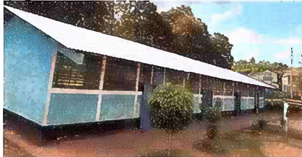
foto: 4 Pintura general, pintura de interiores y exteriores.