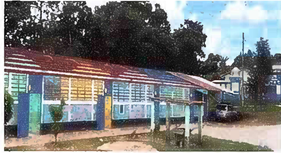
Foto : 2 modulos I, mantenimient de estrucctura de soporte.