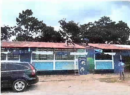
Foto1: modulos I, sustitucion de lamina por lamina aluzin calibre 26 y sustitucion de capote.