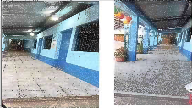
Foto 1: Modulo 1. Sustitución de piso de torta de concreto a piso de granito