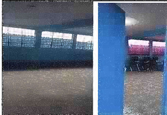
Foto 4: Modulo 2. Sustitución de piso de torta de concreto a piso de granito