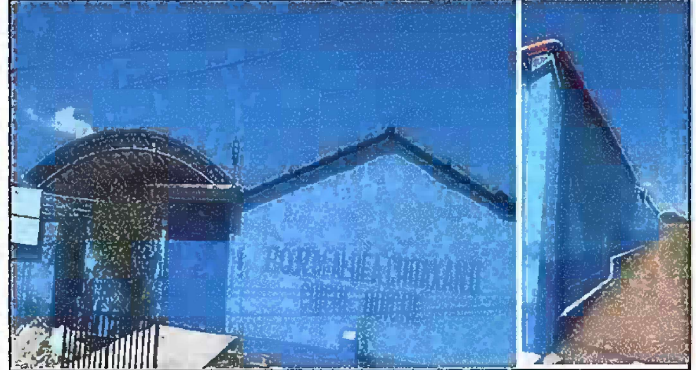
Foto 8: Pintura General: Pintura en muros exteriores e interiores