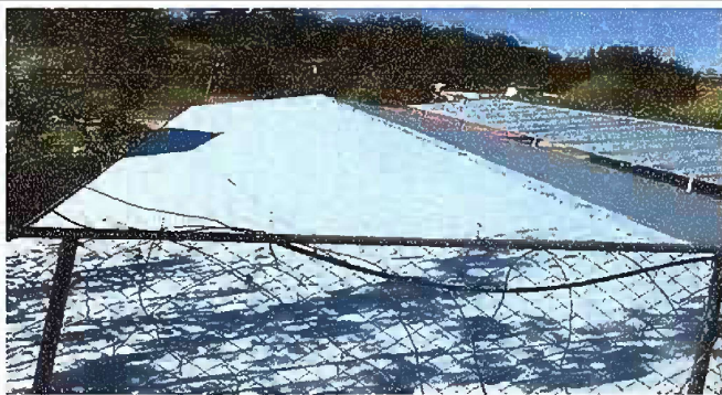
Foto 3: Modulo 2 Sustitución de lamina, por lamina troquelada aluzinc calibre 26