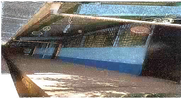
Foto 5: Modulo 2, mantenimiento de estructura de puerta (lijado, cambio de tubo, cepillado, sujeciones, aplicación de pintura) puertas de aula