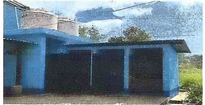
Foto 6: Modulo 2, mantenimiento de estructura de puerta (lijado, cambio de tubo, cepillado, sujeciones, aplicación de pintura) puertas servicios sanitarios

Observación: Si es necesario se pueden agregar hojas adicionales y actualizar el número de hojas.