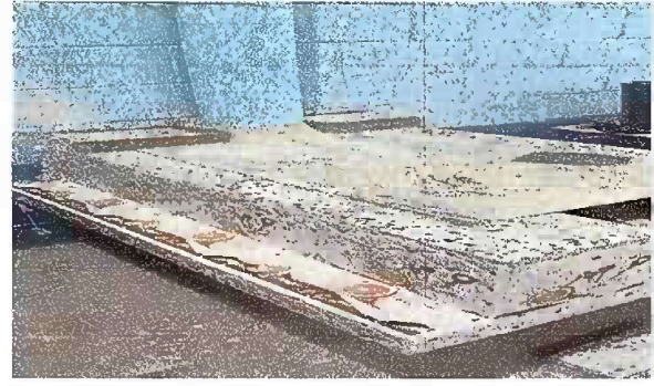
Foto2: MODULO 1. Sustitución de estufas rurales (completa) incluye chimenea y plancha de metal