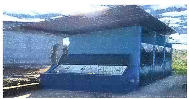
Foto 5: Modulo 3, mantenimiento de estructura de puerta (lijado, cambio de tubo, cepillado, sujeciones, aplicación de pintura) servicios sanitarios