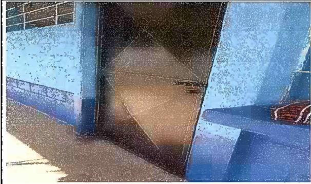
Foto 5: Modulo 3, mantenimiento de estructura de puerta (lijado, cambio de tubo, cepillado, sujeciones, aplicación de pintura) puertas de aula