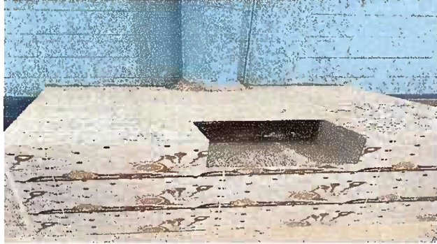
Foto1: MODULO 1. Sustitución de estufas rurales (completa) incluye chimenea y plancha de metal