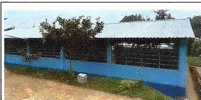
Foto 4: Pintura General, pintura en muros exteriores e interiores