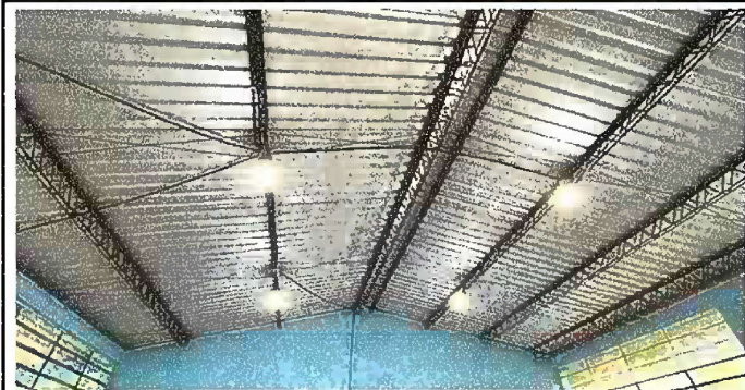
Foto 3: Energia Electrica general, sustitución de lamparas tipo led