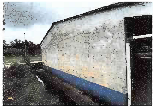
Foto 12: Pintura General, pintura en muros exteriores e interiores

Observación: Si es necesario se pueden agregar hojas adicionales y actualizar el número de hojas.