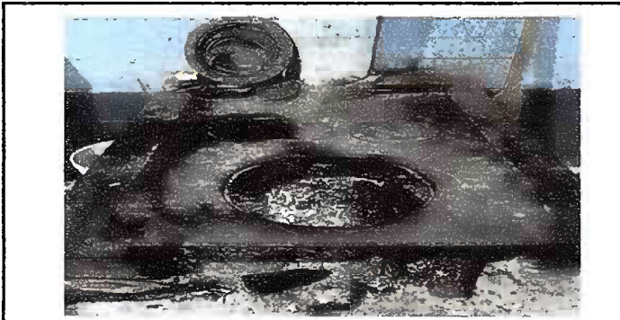
Foto1: MODULO 1. Sustitución de estufas rurales (completa) incluye chimenea y plancha de metal