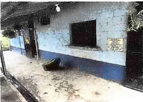
Foto 11: Pintura General, pintura en muros exteriores e interiores