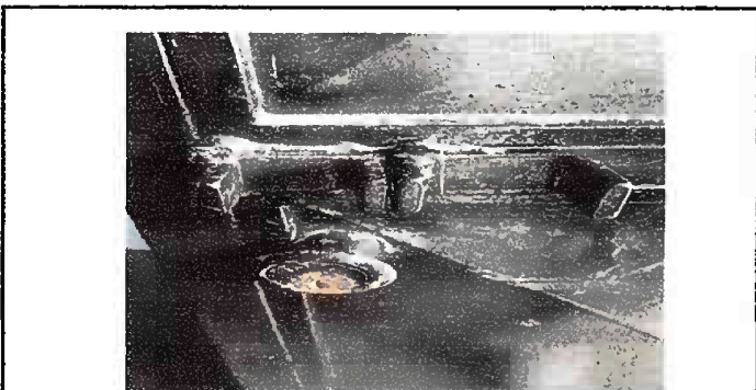
Foto 5: Modulo 2, mantenimiento de estructura de puerta (lijado, cambio de tubo, cepillado, sujeciones, aplicación de pintura) puertas de aula