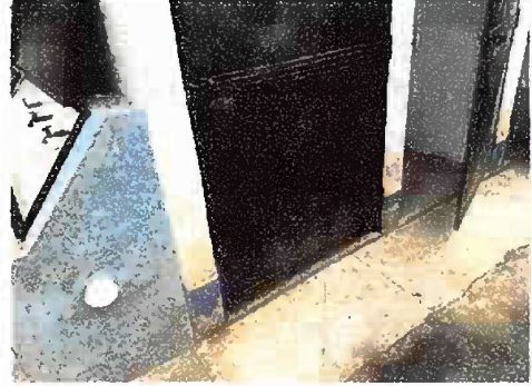
Foto 8: Modulo 3, mantenimiento de estructura de puerta (lijado, cambio de tubo, cepillado, sujeciones, aplicación de pintura) servicios sanitarios