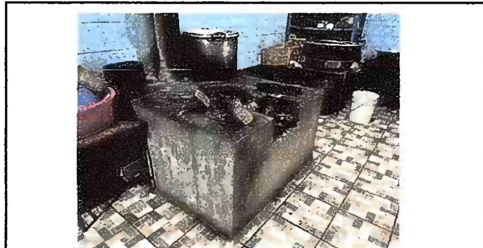
Foto2: MODULO 1. Sustitución de estufas rurales (completa) incluye chimenea y plancha de metal