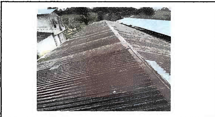
Foto 3: Modulo 2 Sustitución de lamina, por lamina troquelada aluzinc calibre 26