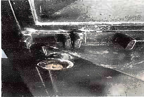
Foto 7: Modulo 3, mantenimiento de estructura de puerta (lijado, cambio de tubo, cepillado, sujeciones, aplicación de pintura) puertas de aula