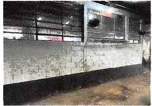
Foto 10: Pintura General, pintura en muros exteriores e interiores