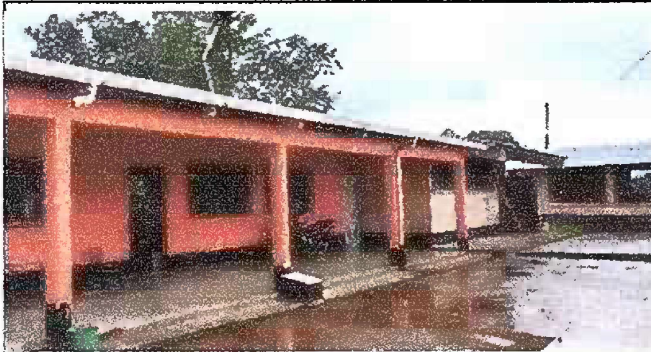
Foto 3: Modulo 1. Colocacion de balcones en frente y atrás, pintura en paredes exteriores.