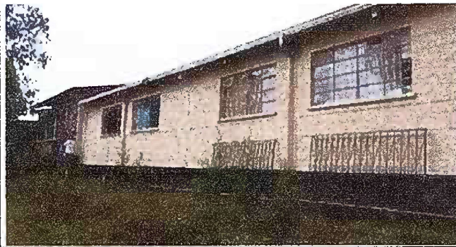
Foto 1: Modulo 1. Colocacion de balcones y sustitucion de canales de pvc por metal y pintura en paredes exteriores.