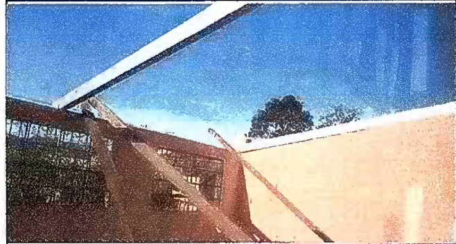
Foto 4: Modulo 2. Sustitucion de estructura de soporte de madera por metal.