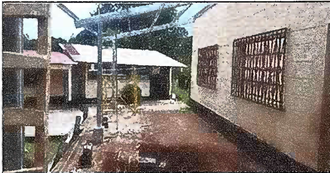
Foto 5: Modulo 2. Sustitucion de estructura de soporte de madera por metal.