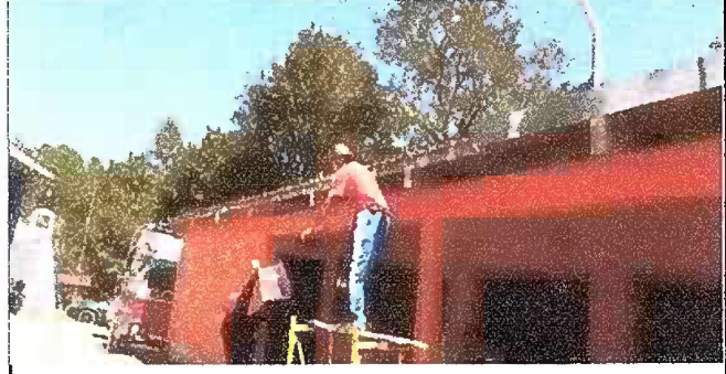
Foto 2: Modulo 1. Sustitucion de canales de pvc por metal y pintura en paredes exteriores.