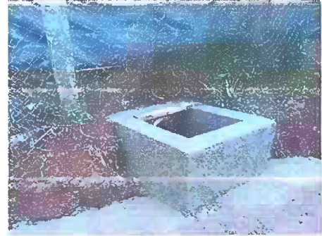
Foto 2: PATIO Sustrucción de tubería PVC línea principal aguas pluviales