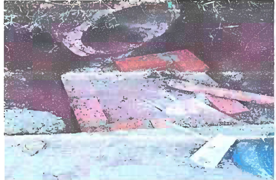
Foto 2: PATIO Sustitución de tubería PVC línea principal aguas pluviales