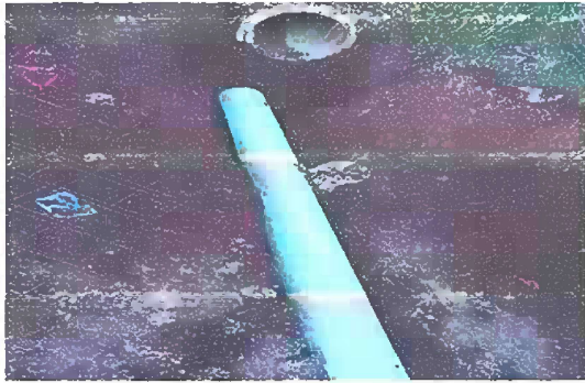
Foto1 PATIO: Sustitución de tubería PVC línea principal aguas pluviales