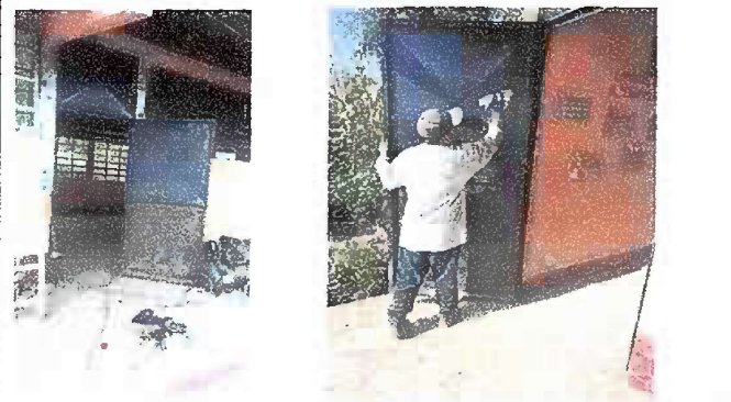
Modulo 1: Mantenimiento a estructura de puerta lijado y pintado