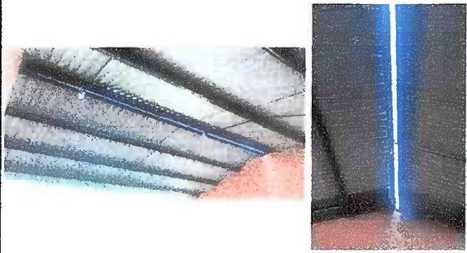
Modulo 1: sustitución de lámina por lámina troquelada, sustitución de capote, sustitución de canales, sustitución de pescante, sustitución de bajada de agua pluvial de PVC.