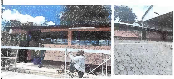
Modulo 1: Sustitucion de canales PVC, prescantes