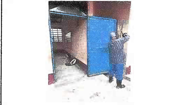
Modulo 2: Mantenimiento a estructura de puerta lijado y pintado