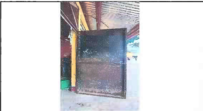
Foto 1 y 2: Mantenimiento a estructura de puerta lijado y pintado