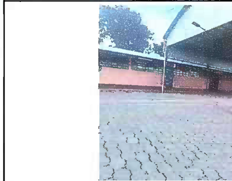
Modulo 2: Sustitución de canales PVC, pescantes.