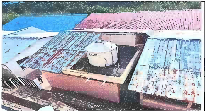
Foto 4: Sustitución de lámina troquelada, sustitución de capote, sustitución de canales, sustitución de pescante, sustitución de bajada de agua pluvial de PVC.