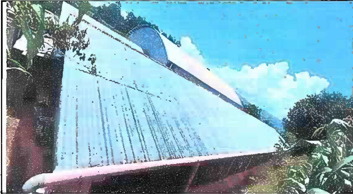
Modulo 1: sustitución de lámina por lámina troquelada, sustitución de capote, sustitución de canales, sustitución de pescante, sustitución de bajada de agua pluvial de PVC.