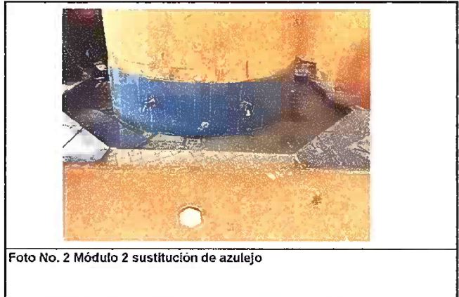
Foto No. 2 Módulo 2 sustitución de azulejo