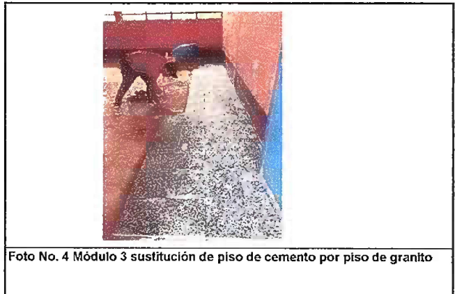
Foto No. 4 Módulo 3 sustitución de piso de cemento por piso de granito