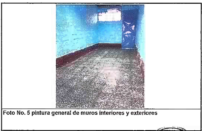
Foto No. 5 pintura general de muros interiores y exteriores