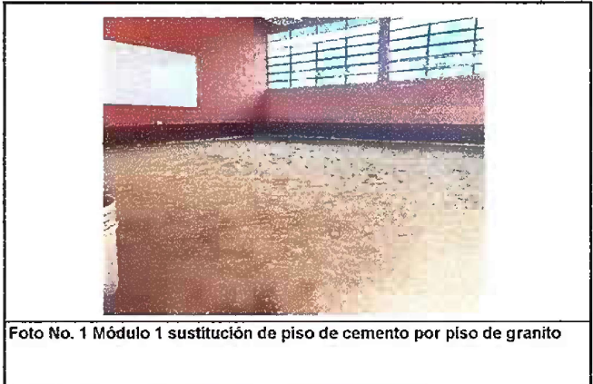
Foto No. 1 Módulo 1 sustitución de piso de cemento por piso de granito