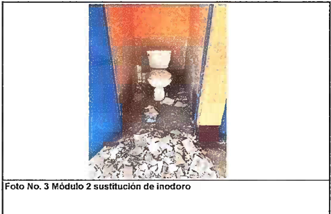
Foto No. 3 Módulo 2 sustitución de inodoro