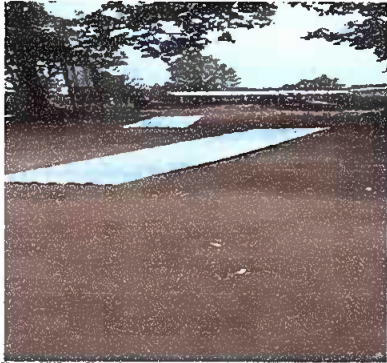
Foto 11: EN LA FECHA 10 DE MAYO 2024 SE COMPRA Y SE RECIBE LA LAMINA QUE SERVIRÁ PARA EL CAMBIO DE TECHO DEL MODULO 2 Y 3