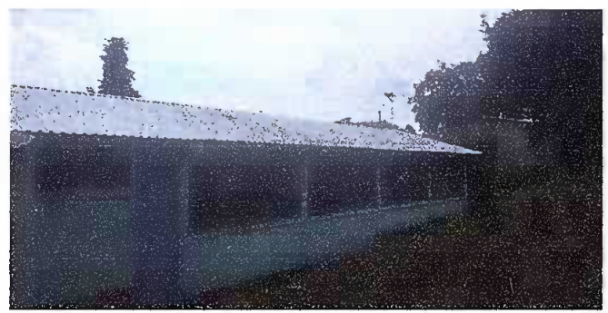
Foto 16: FINALIZADA LA COLOCACIÓN DE LA NUEVA LAMINA TROQUELADA EN EL MODULO 3.

Observación: Si es necesario se pueden agregar hojas adicionales y actualizar el número de hojas.