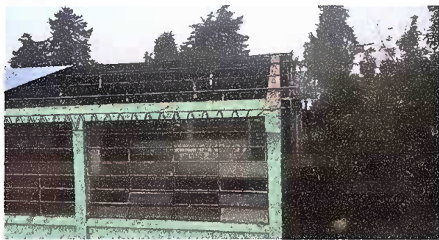
Foto 15: AVANCE DE UN 90% DE LA COLOCACIÓN DE LA NUEVA LAMINA ROQUELADA EN EL NODULO 3.