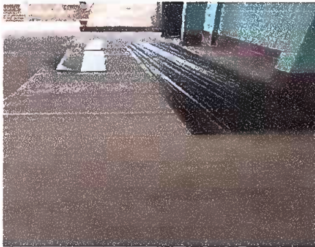
Foto 13: COSTANERAS QUE SERVIRÁ PARA SUJETAR LAS LAMINAS EN EL MOULO 3.