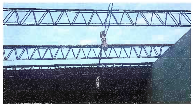
Foto 14: INICIO DEL DESMONTAJE DE LAMINA EXISTENTE EN EL MODULO 3